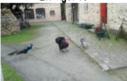
Tupp och påfågel